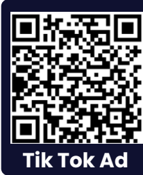
Tik Tok Ad